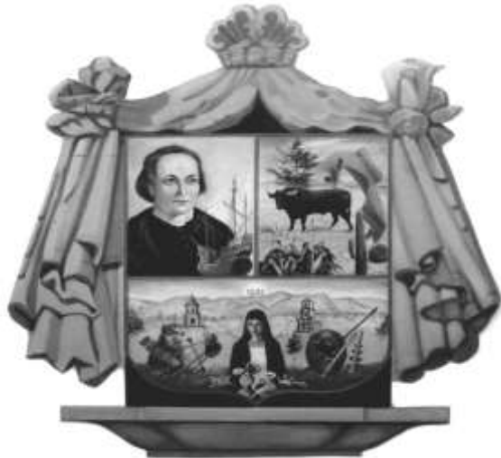
PRESIDENCIA MUNICIPAL COLÓN, QRO.